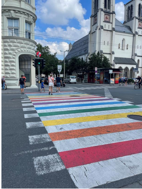
Regenbogen-Zebrastreifen in Salzburg