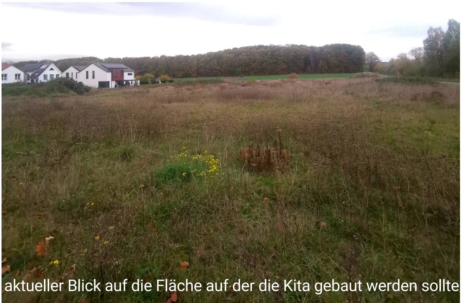
aktueller Blick auf die Fläche auf der die Kita gebaut werden sollte