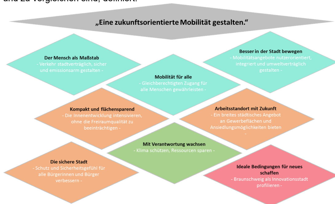
Abbildung 1: Fachübergreifende Strategien des ISEK mit Mobilitätsbezug (farbliche Unterteilung gemäß ISEK)

Um sicherzustellen, dass strategische Entscheidungen unter Berücksichtigung aller relevanter Belange zielgerichtet getroffen und die vielen Einzelthemen zu Mobilitätsfragen integriert für Braunschweig betrachtet werden, wurde unter Berücksichtigung der fachbereichsübergreifenden Strategien des beschlossenen ISEK eine Konkretisierung für den Bereich Mobilität vorgenommen. Im Ergebnis stehen die strategischen Zielfelder des MEP. Diese Zielformulierung bestimmt maßgeblich die Gesamtstrategie des MEP und bildet die Basis für die Chancen- und Mängelanalyse, die Festlegung des Zielszenarios, die Auswahl und Priorisierung von Maßnahmen sowie die abschließende Umsetzungsstrategie. So werden zum Beispiel auf Grundlage der strategischen Zielfelder des MEP die Bewertungskriterien und Indikatoren, mit denen die Szenarien und Maßnahmen zu bewerten und zu vergleichen sind, definiert.