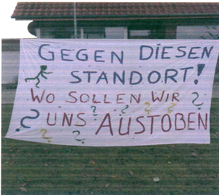
Bild 1: Tobeplatz, geplanter Standort für den Garten d. Erinnerung

Bildung einer Bürgerinitiative: Nach Bekanntwerden der Planung hat sich spontan eine Bürgerinitiative von 200 Personen gebildet. Die BI unterstützt die Pläne der Stadt zur Errichtung des Gartens und stellt dessen Bedeutung für den Wunsch nach Frieden und einer guten Nachbarschaft in Europa nicht in Frage. Sie möchte auch, dass der Garten der Erinnerung im Bereich des oben genannten Grünzuges realisiert wird. Die BI stellt die Frage an die Planer, ob es nicht möglich ist, die Planung zu verändern, dass der Garten der Erinnerung so verortet wird, dass der Bolzplatz für die Kinder erhalten bleiben kann.