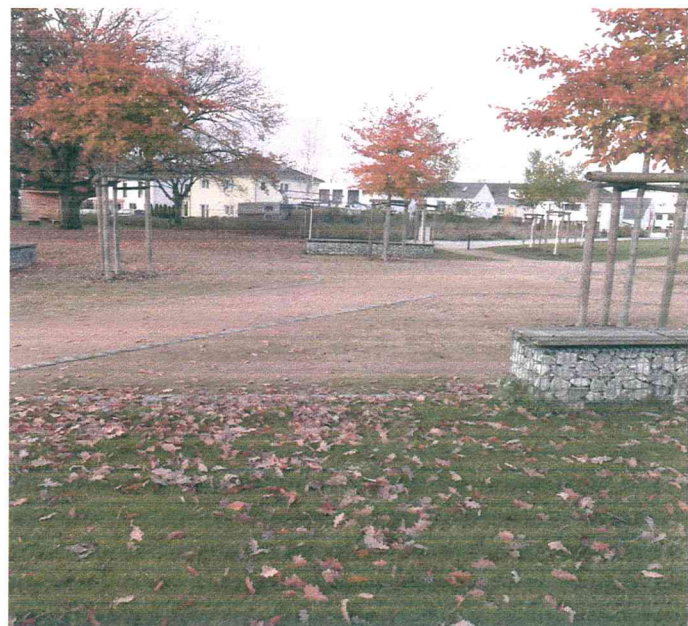
Bild 2 möglicher Standort für den Garten der Erinnerung

Stellungnahme des bs forum: Die Spielfläche wird von den Kindern gut angenommen und auch von den Eltern wegen seiner Nähe zu den Häusern sehr geschätzt. Die Kinder können bei Bedarf schnell nach Hause laufen und die Unterstützung ihrer Eltern finden. Ein Spielareal für größere Kinder findet sich nördöstlich der Blochmannstr. Dieses kann von den jüngeren Kindern nicht oder deutlich schlechter genutzt werden, weil es zu weit von den Wohnhäusern entfernt liegt. Der Wegfall des Spielareals für die kleineren Kindern würde diese in ganzer Härte treffen.