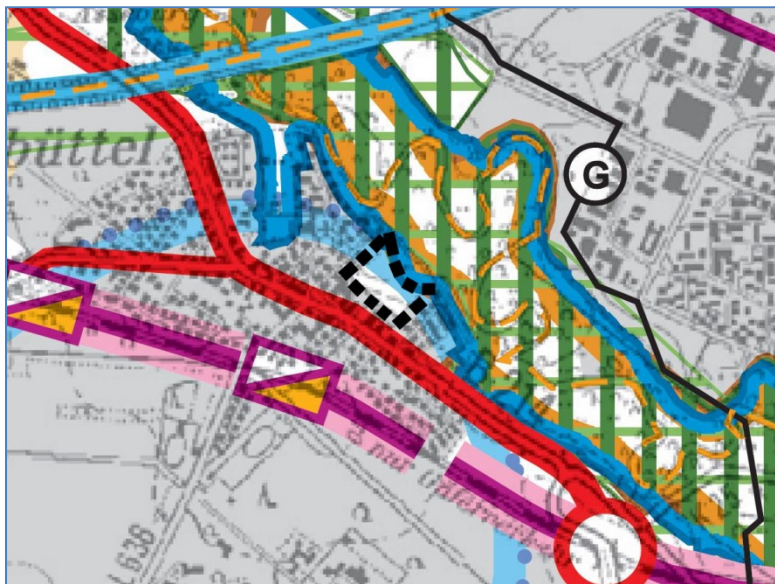
Abb. 1: Kartenausschnitt RROP, Kartenblatt Mitte-West Geltungsbereich 114. Änderung schwarz gestrichelt umrandet

Das RROP 2008 legt für den Geltungsbereich die Lage im „Vorbehaltsgebiet (Grundsatz der Raumordnung) Trinkwassergewinnung“ dar.