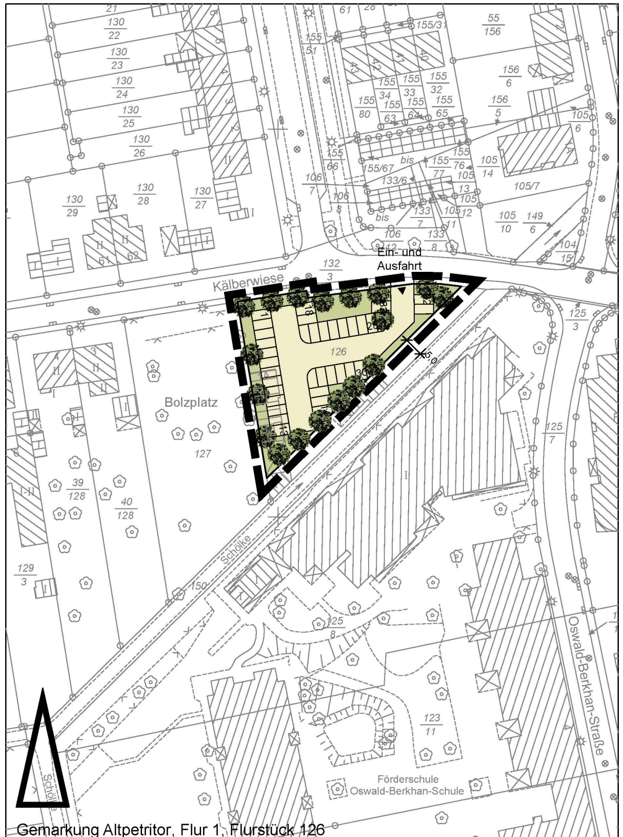
Gemarkung Altpetritor, Flur 1, Flurstück 126

Vorhabenplan/ Lageplan, Stand: 07.01.2015, § 10 (1) BauGB